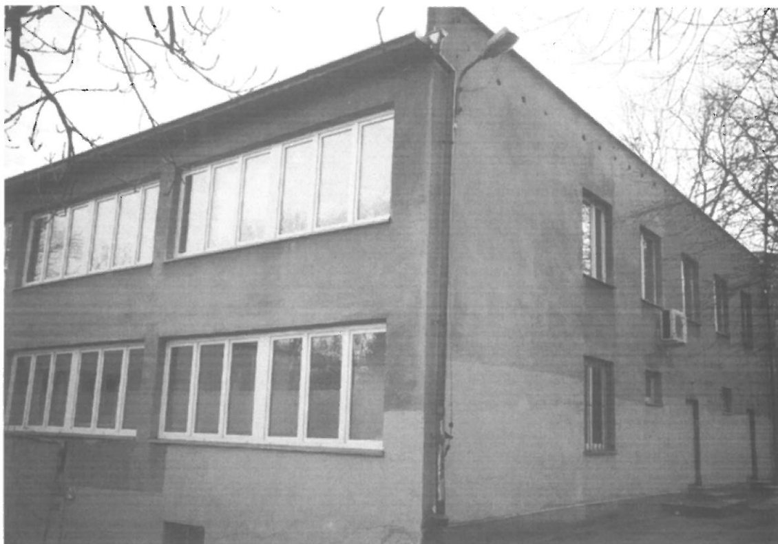
Fot. 7. Kraków, Radomska 36 – segment II ściana północno-zachodnia i północno-wschodnia budynku