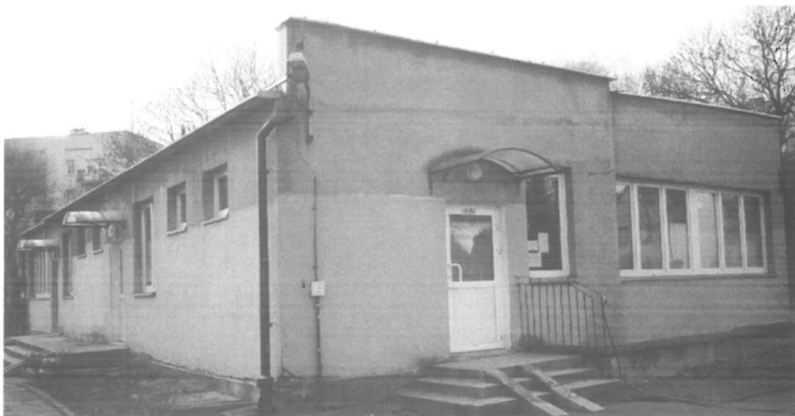
Fot. 3. Kraków, Radomska 36 – segment I ściana południowo-wschodnia i północno-wschodnia budynku