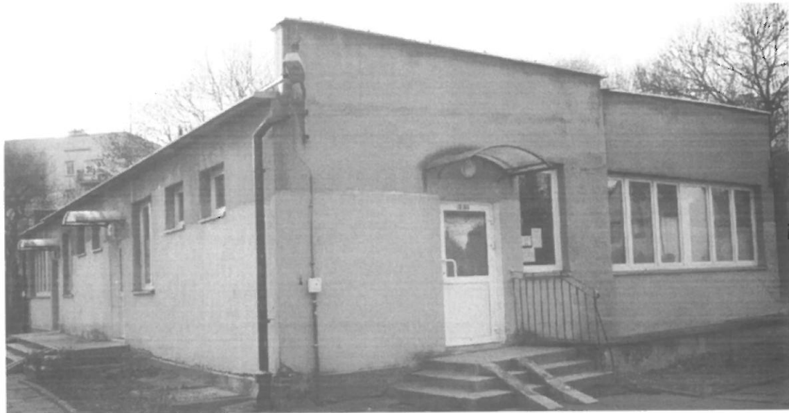
Fot. 3. Kraków, Radomska 36 – segment I ściana południowo-wschodnia i północno-wschodnia budynku