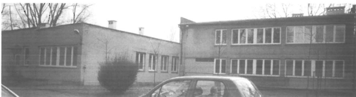
Fot. 4. Kraków, Radomska 36 – segment I ściana północno-zachodnia i północno-wschodnia budynku, segment II ściana północno-wschodnia budynku