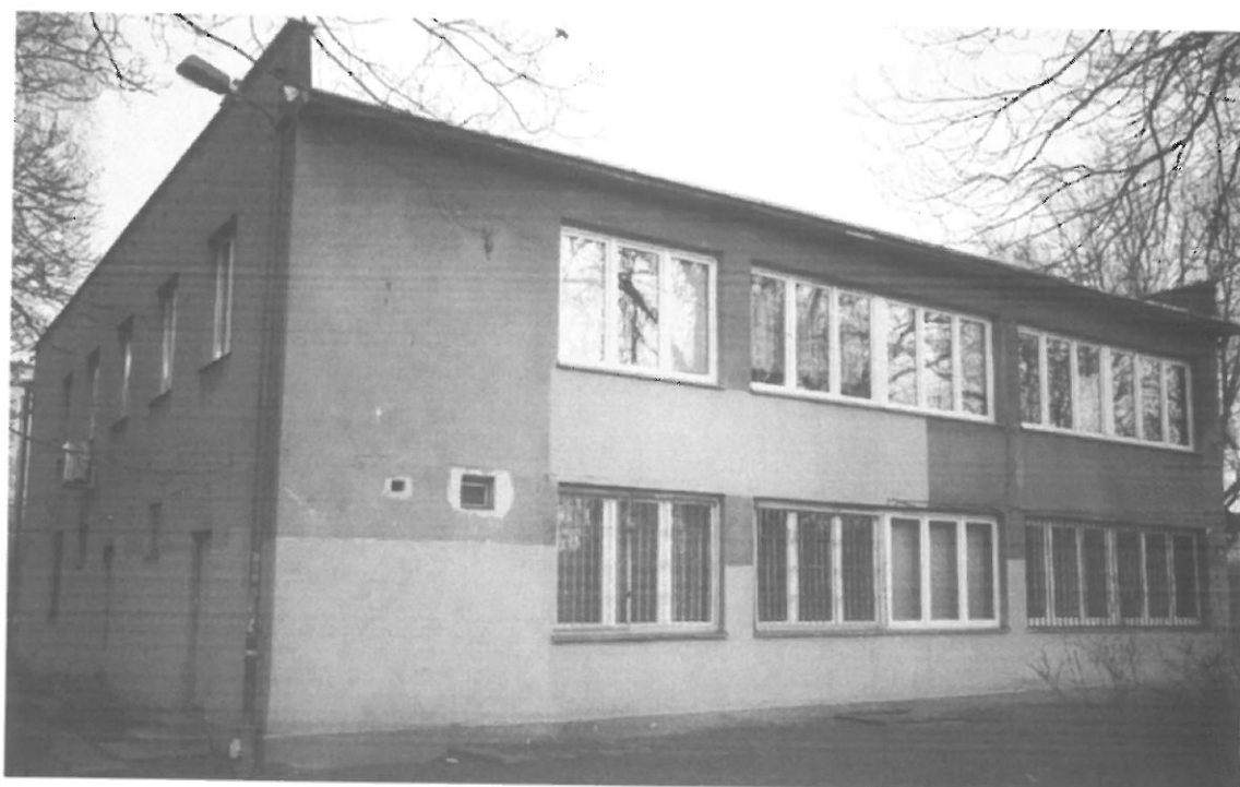
Fot. 6. Kraków, Radomska 36 – segment II ściana południowo-zachodnia i północno-zachodnia budynku