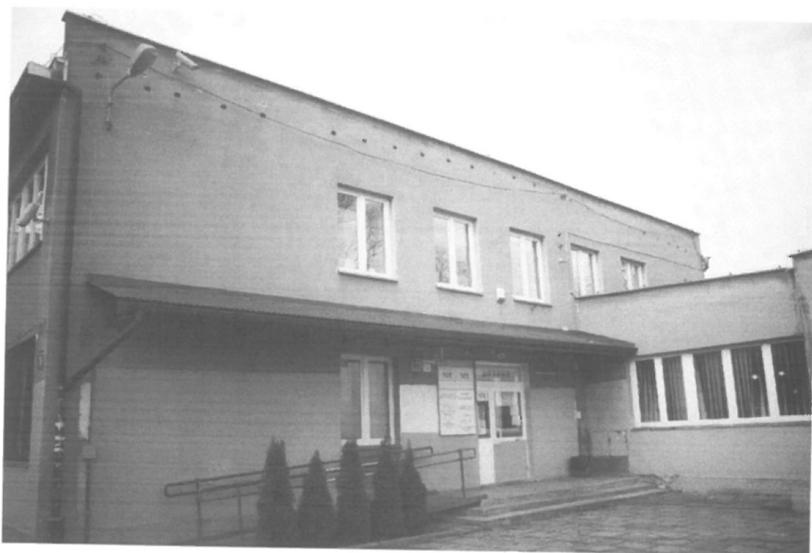
Fot. 5. Kraków, Radomska 36 – segment II ściana południowo-wschodnia budynku