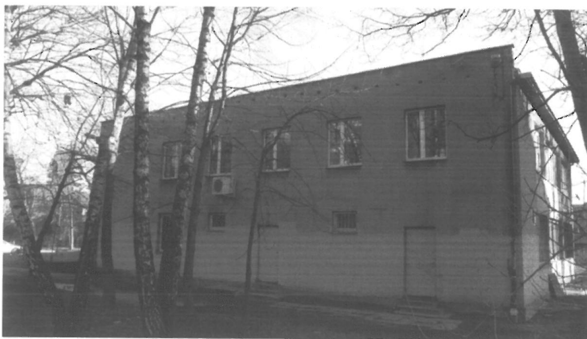
Fig. 5. Kraków, ul. Radomska 36, ściana północno-zachodnia budynku (segment II).