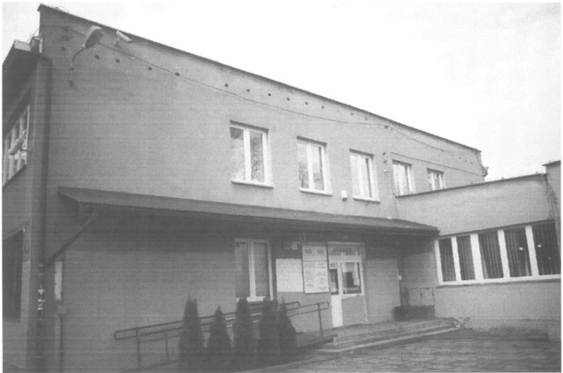
Fot. 5. Kraków, Radomska 36 – segment II ściana południowo-wschodnia budynku