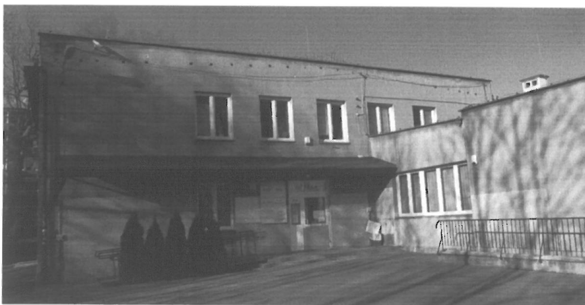
Fig. 3. Kraków, ul. Radomska 36, ściana południowo-wschodnia (II segment) i południowo zachodnia budynku (I segment).