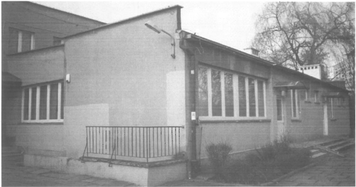
Fot. 2. Kraków, Radomska 36 – segment I ściana południowo-zachodnia i południowo-wschodnia budynku