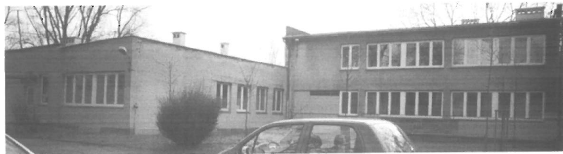
Fot. 4. Kraków, Radomska 36 – segment I ściana północno-zachodnia i północno-wschodnia budynku, segment II ściana północno-wschodnia budynku