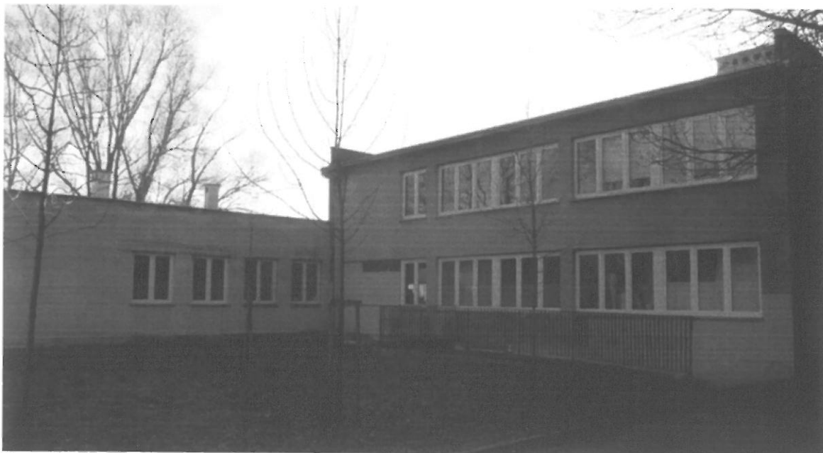
Fig. 6. Kraków, ul. Radomska 36, ściana północno-zachodnia budynku (segment I) i północno-wschodnia budynku (segment II).