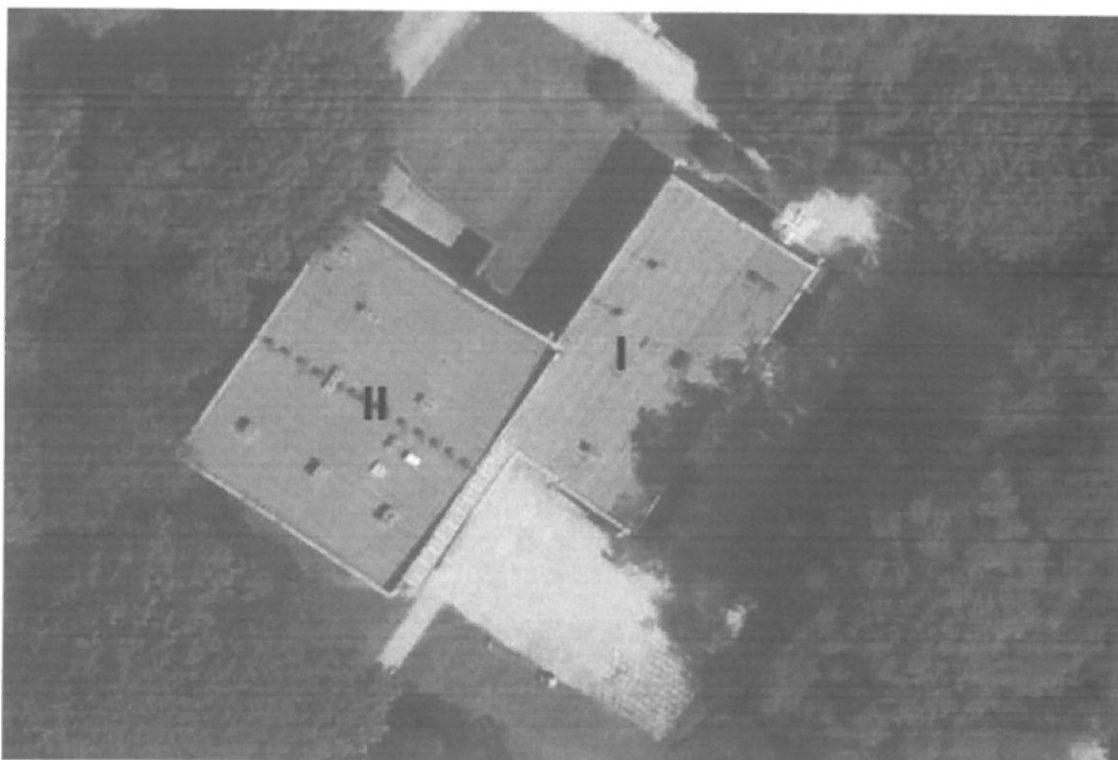
Fot. 1. Kraków, Radomska 36 – zdjęcie sat. z zaznaczonymi segmentami budynku ( http://mapy.geoportal.gov.pl/imap/ )

Dachy są dwuspadowe (na zewnątrz). W budynku znajduje się nieocieplony stropodach. W stropodachu znajdują się drożne, zakratowane otwory wentylacyjne o wymiarach 10x10 cm.