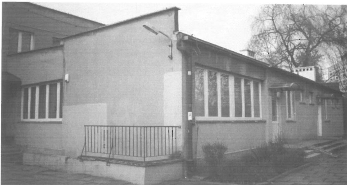
Fot. 2. Kraków, Radomska 36 – segment I ściana południowo-zachodnia i południowo-wschodnia budynku