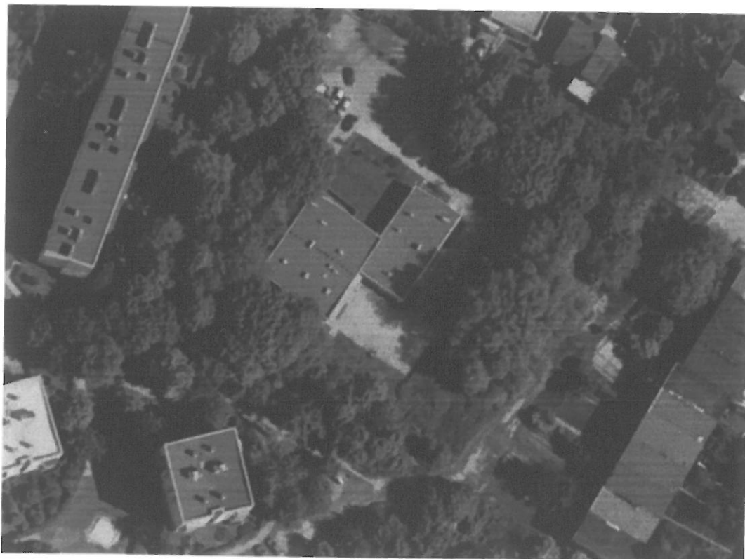
Fig. 1. Kraków, ul. Radomska 36 – zdjęcie sat. ( http://mapy.geoportal.gov.pl/imap/ ).

Dachy dwuspadowe (na zewnątrz). W budynku występuje niecieplony stropodach. W stropodachu znajdują się zakratowane otwory wentylacyjne.