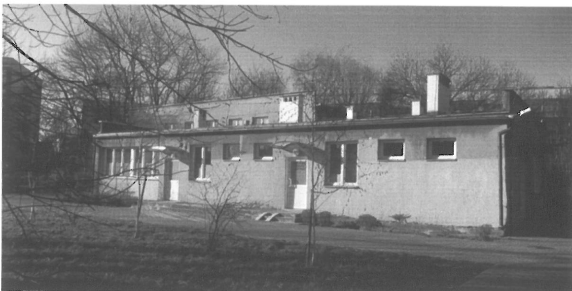
Fig. 2. Kraków, ul. Radomska 36, ściana południowo-wschodnia i północno-wschodnia budynku (segment I).