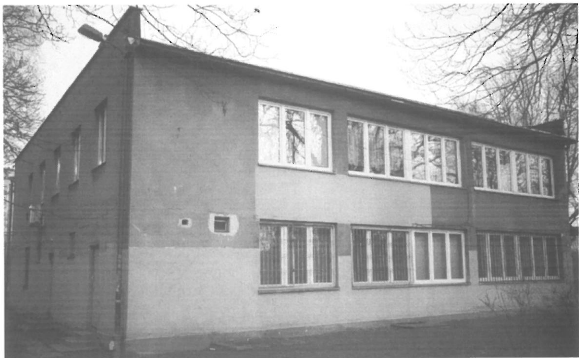
Fot. 6. Kraków, Radomska 36 – segment II ściana południowo-zachodnia i północno-zachodnia budynku